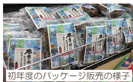
初年度のパッケージ販売の様子

地域の企業・団体のご協力により、各賞を設けています。最優秀に選ばれた絵は、お菓子のパッケージに採用され、杏林堂薬局各店舗にて販売予定です。