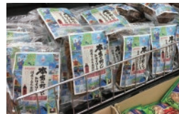
初年度のパッケージ販売の様子

地域の企業・団体のご協力により、各賞 を設けています。最優秀に選ばれた絵は お菓子のパッケージに採用され、杏林堂 薬局各店舗にて販売予定です。